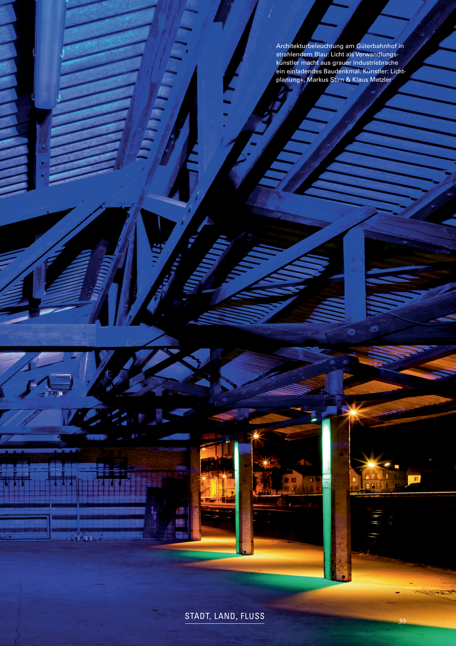
Architekturbeleuchtung am Güterbahnhof in strahlendem Blau: Licht als Verwandlungskünstler macht aus grauer Industriebrache ein einladendes Baudenkmal. Künstler: Lichtplanung+, Markus Stirn & Klaus Metzler